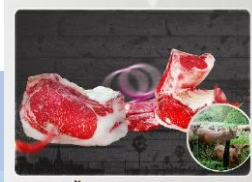
เนื้อโคขุนโพนยางคำ Pon-Yang-Khram Beef