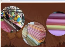
ผ้าไหมปักธงชัย Pak Thong Chai Thai Silk