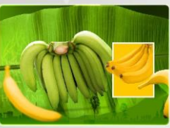
กล้วยหอมทองพมพระ- Kluay Hom Thong Phop Phra