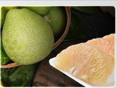
ส้มโอนครชัยศรี Nakhonchai Sri Pomelo