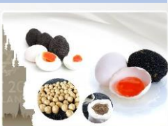
ไข่เค็มไชยา Chaiya Salted Eggs