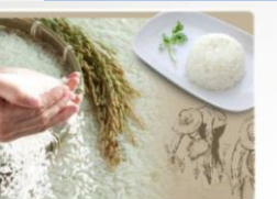
ข้าวหอมมะลิทุ่งกุลาร่องไห้ Thung Kula Rong-Hai Thai Hom Mali Rice

ปัจจุบัน ขึ้นทะเบียนสินค้า GI ไทย รวม 171 สินค้า จาก 77 จังหวัด สามารถสร้างมูลค่าการตลาดรวมกว่า 40,000 ล้านบาท