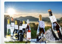
ไวน์ชาใหญ่ Khao Yai Wine